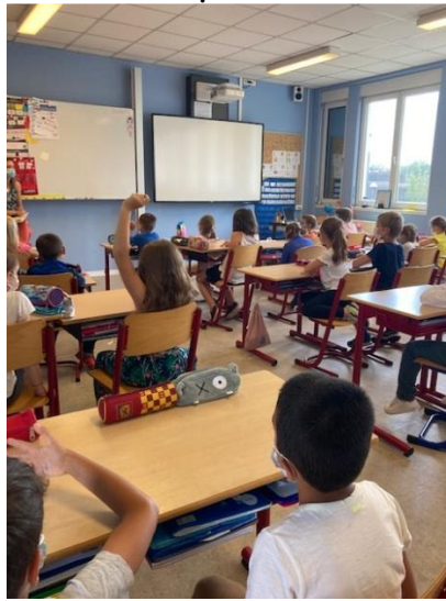
Salle de classe

Durant la semaine, votre enfant étudiera le français (lecture, écriture et étude de la langue), les mathématiques mais aussi les sciences, l'histoire, la géographie, l'art plastique et l'histoire de l'art, la musique, l'allemand, l'éducation morale et civique et le sport. Vous pourrez, si vous le souhaitez, également inscrire votre enfant en religion en début d'année. (Cette heure fait partie du temps scolaire). En Alsace, l'enseignement de l'allemand est imposé.