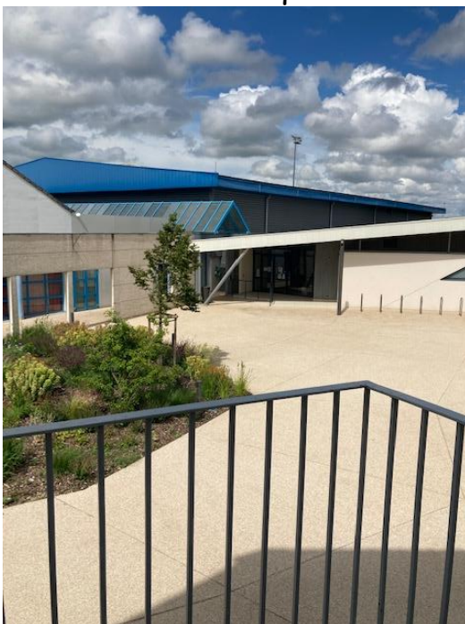
Gymnase, salle des fêtes et Dojo

Des projets annuels et des rencontres sportives pourront avoir lieu avec d'autres écoles durant l'année et vous seront communiqués le moment venu.